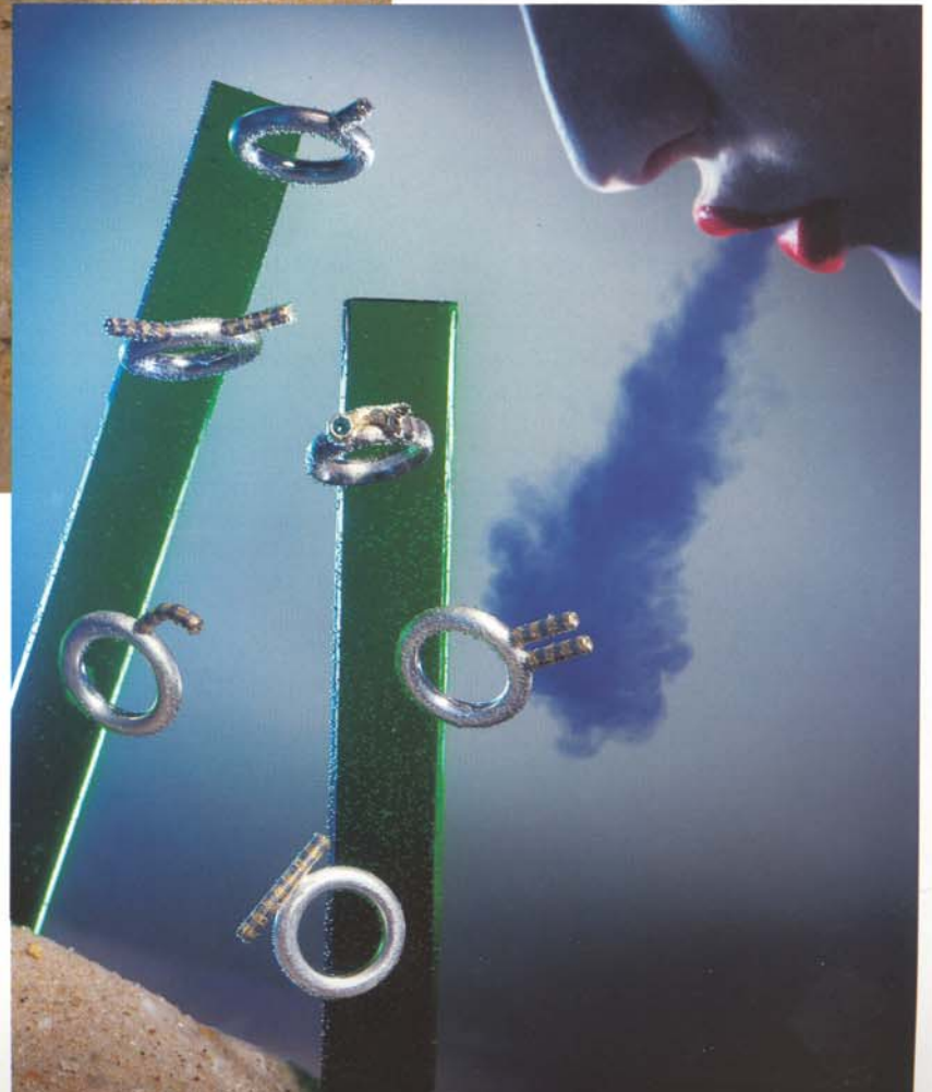
Tiefsee, Moräne, Krabbe, Hummer, Hammerhai, Nixe; 6 Ringe aus Silber, Gold, Palladium und Brillanten, (Nixe Turmalin)