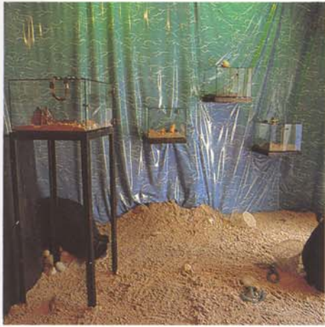
Galerie Gesamtmetall während der Ausstellung »Unterwasserwelten«